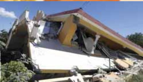
Earthquake in Puerto Rico

SI BUSCA EMPLEO VEA LA PAGINA 17 LOOKING FOR JOB? READ PAGE 17