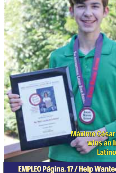
EMPLEO Página. 17 / Help Wanted