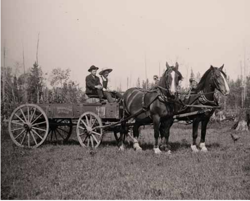
Horse and carriage (public domain): Many freedom seekers used a horse and carriage from the late 1700's until the Civil War (1865).