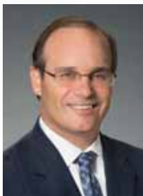
Chip Rossi Presidente de Bank of America en Delaware

A través de este esfuerzo, nuestro equipo en Delaware entregó recientemente a Food Bank of Delaware un cheque por $350,000. Esta contribución se suma a nuestro prolongado apoyo filantrópico para ayudar a combatir el hambre y la inseguridad alimentaria en todo el país. Estamos orgullosos de poder ayudar a nuestra comunidad mientras trabajamos juntos para seguir adelante.