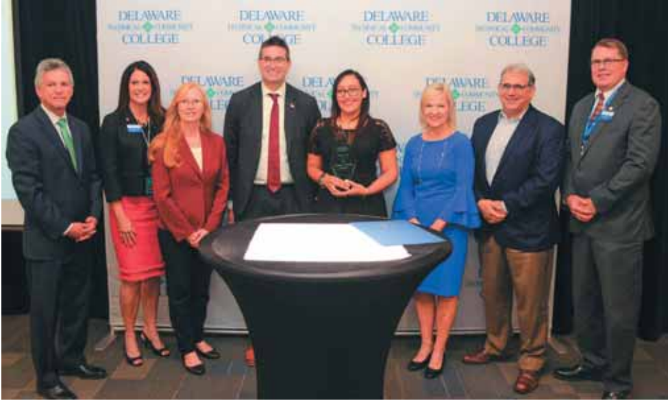
Leos began her outreach to the Hispanic community in Delaware when she began a home baking business in 2011.

Delaware Tech is proud to celebrate Hispanic Heritage Month. This month Deltech honored a member of the community for her commitment to the Hispanic culture in northern Delaware.